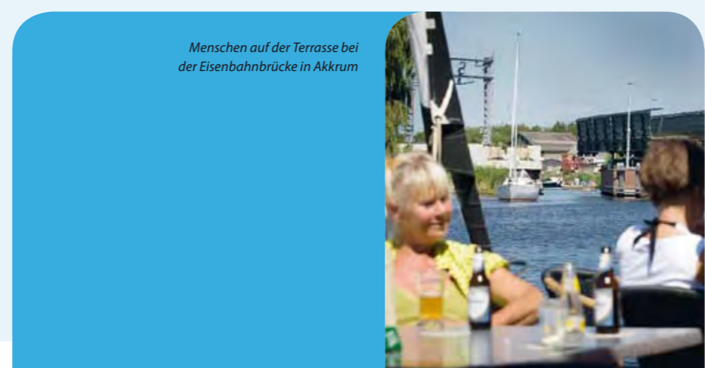
Menschen auf der Terrasse bei der Eisenbahnbrücke in Akkrum

Nördlich um Leeuwarden Schiffe mit stehendem Mast können auch um Leeuwarden herum fahren. Der Stehenden Mastroute kann auch in nördlicher Richtung gefolgt werden. Sie fahren den Prinsentuin entlang zur Dokkum, via Dokkumer Ee, einem berühmten Abschnitt des Schlittschuhmarathons "Elfstedentocht". www.frieslanderleben.nl/stehende-mastroute